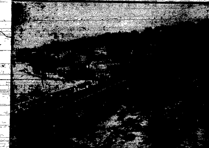
Charakterystyczny wygląd andrzejskiego miasta.