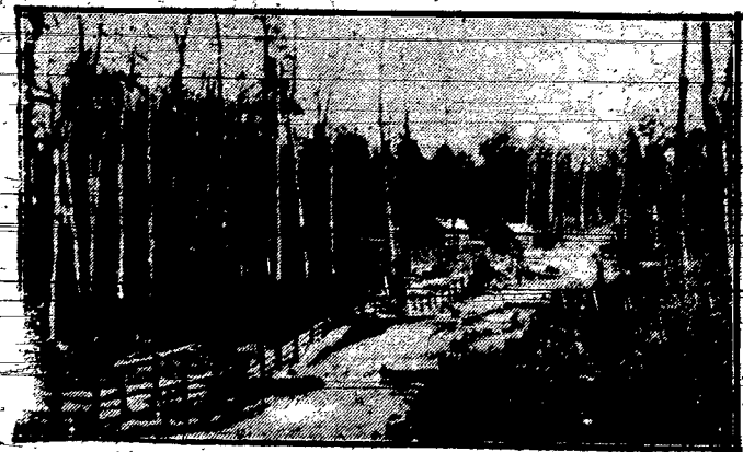
Typowa droga wiejska w osadach kolumbijskich.

REKLAMA Wobec częstych wypadków zaufania gazem, gazownie mają zamiar zmniejszyć swą reklamę w tym sensie: — Gotujcie na gazie! Smacznego na gazie!! Umięrajcie na gazie!!!