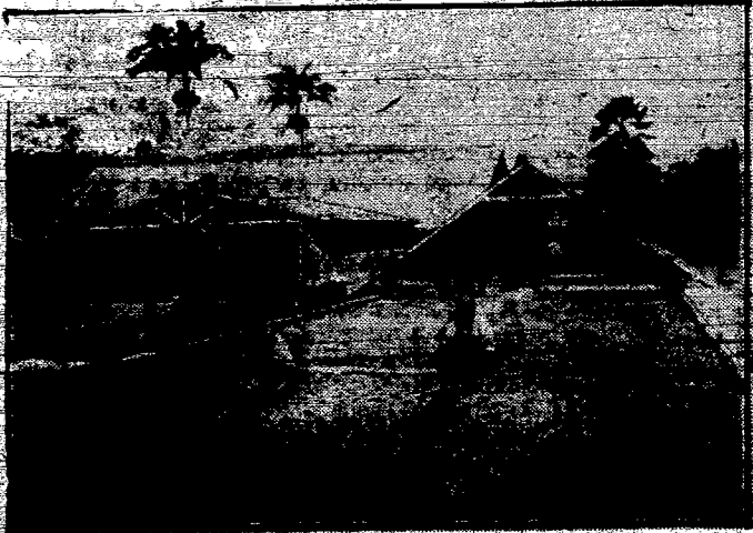
Kolumbia słynna jest z bogatych zbiorów kakao.