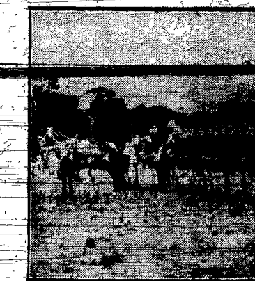
Koloniści kolumbijscy w galowych mundurach podczas uroczystości narodowych.