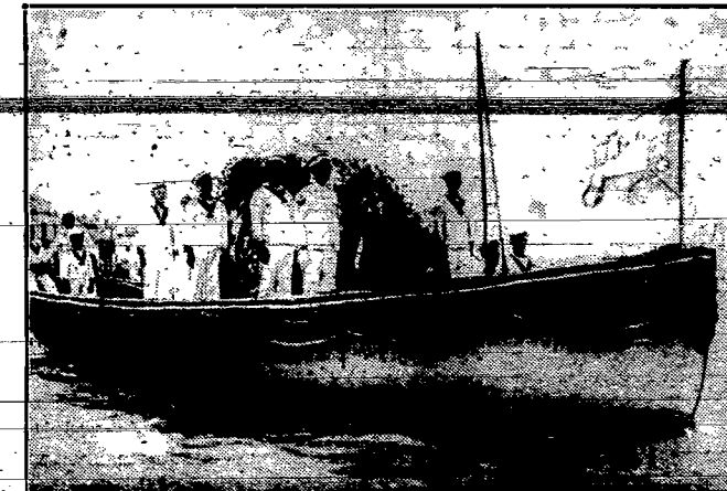
Złoty król Iraku Fejsala w drodze na okręt, który przewiezie go do ojczyzny.