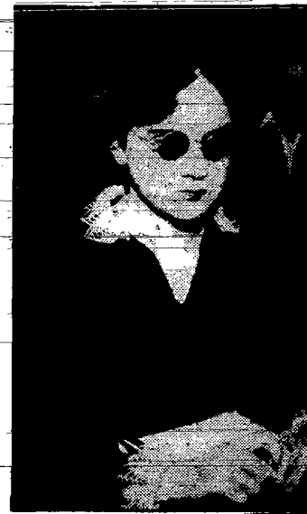
W konkursie paryskich stenotypistek zdobyła nagrodę doroczną niewidoma z N. Y.