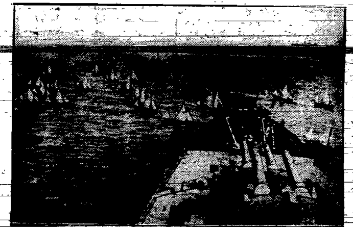
Z manewrów floty angielskiej. Ćwiczenia na małych jolkach żaglowych.