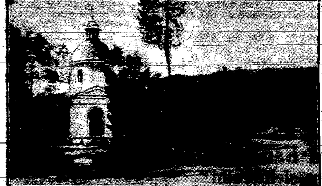
Kapliczka w Zarwanicz miejsce pielgrzymek okolicznej ludności.

leskiego-mielisnym — możność zapoznania się z szeregiem okolicznych miejscowości.