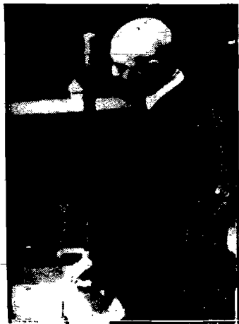
Walery Sławek, prezes Bloku Bezpartyjnego, h. premier.

Jednocześnie stało się wiadome, iż p. Prezydent przyjął dymisję gabinetu, polecając p. premierowi i ministrom pełnienie obowiązków do czasu mianowania nowego gabinetu.