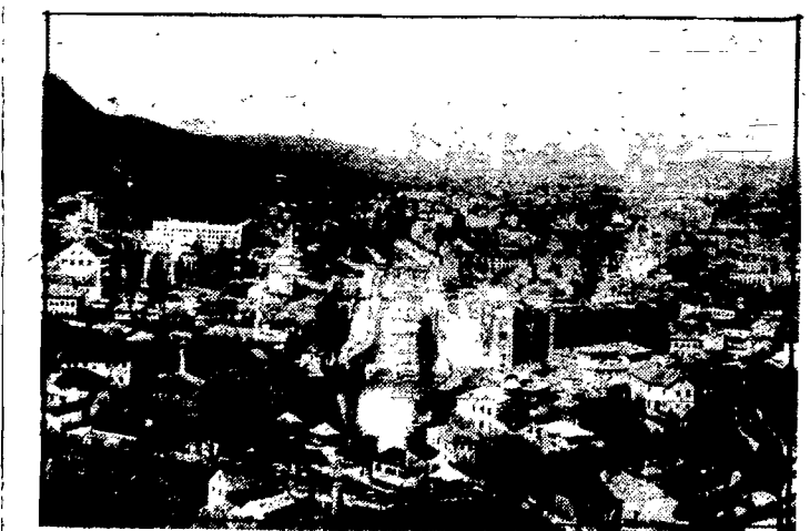
Hercegowina i południową Dalmację dotknięte zostały silnym trzęsieniem ziemi. Na zdjęciu miasto Sarajewo przed katastrofą.

Mezczyźni ustępują naogół kobietom w urodzie, a nawet... nie tylko w urodzie, bo naprzykład konduktorami tramwajów i kolei.