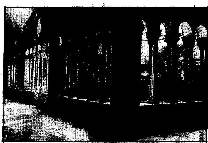
Klasztor OO. Franciszkanów w Raguzie.

prawie bez fabryk i kopalni; jest zaś rzeczą wiadomą i oczywistą, że nie rolnictwo a przemysł rodzi bezrobocie.