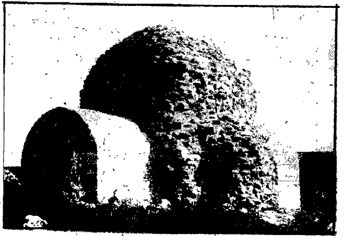
Do najstarszych zabytków budownictwa kamiennego należą ruiny kościoła w R. ab.