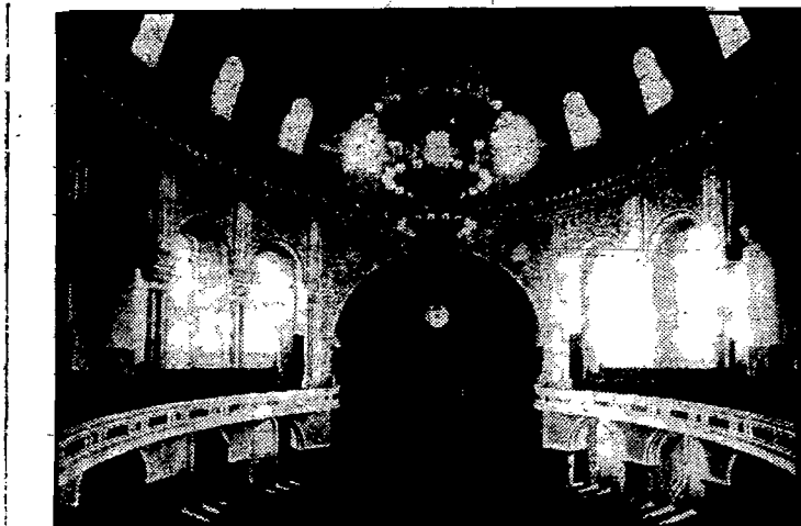
Bizantyjskie wnętrza synagogi w Sarajewie.

najpiękniejszych krajobrazów, najzmienniejszych widoków i najróżnorodniejszych typów ludności: