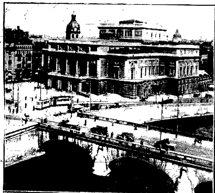
Most Wawel w Sztokholmie nad jednym z licznych kanałów, które stolicy Szwecji zyskały między „Wenecji Północnej”.