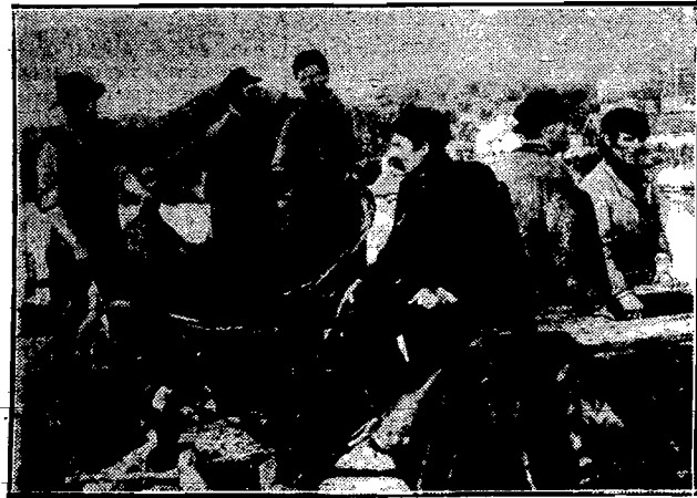
Typowe wilki morskie z rybackich osiedli nadbałtyckich.

jak o wielkoludach z sagi. My zato — dzięki Sienkiewiczowi — dobrze pamiętamy o potopie krwi i ognia, jakim Szwecja zalała za nieszczęsnej pamięci Wazów nasz kraj.