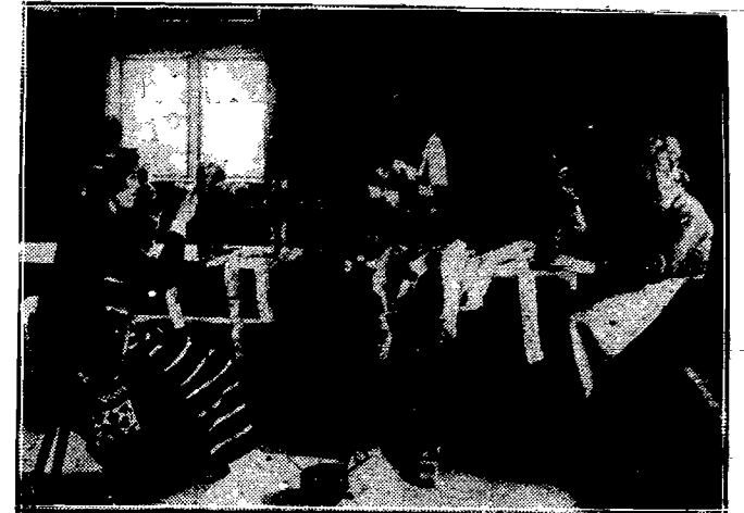
Wiesniaczki szwedzkie w strojach narodowych.

niesłychaną wprost uczciwością każdego Szweda (o Kreugerze nie mówimy). Dość powiedzieć, że zau b.wszy drogocejący przedmiot — cudziennem może wracać ta sa