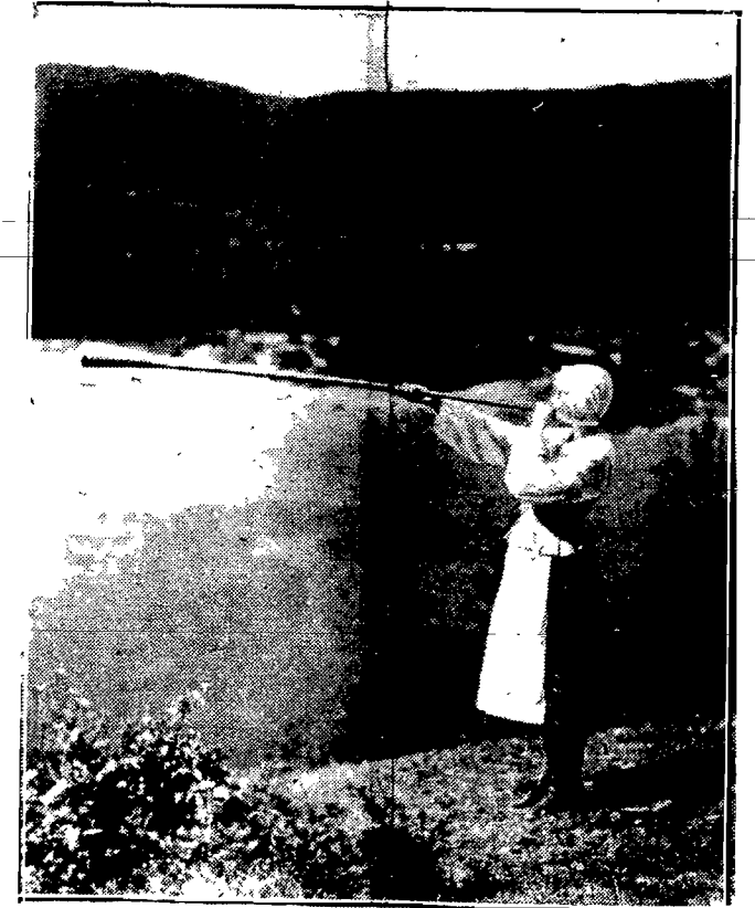
Wiesniaczka z rozgum pastyrskim służącym do zwolowywania krów z paszy. Dziecko z nad najpiękniejszego jeziora Szwecji — Wenner.

twórczość i handel wzrosły niepomniernie, szczególnie dzięki niejednemu wykorzystaniu przeziębionych włościwości kraju.