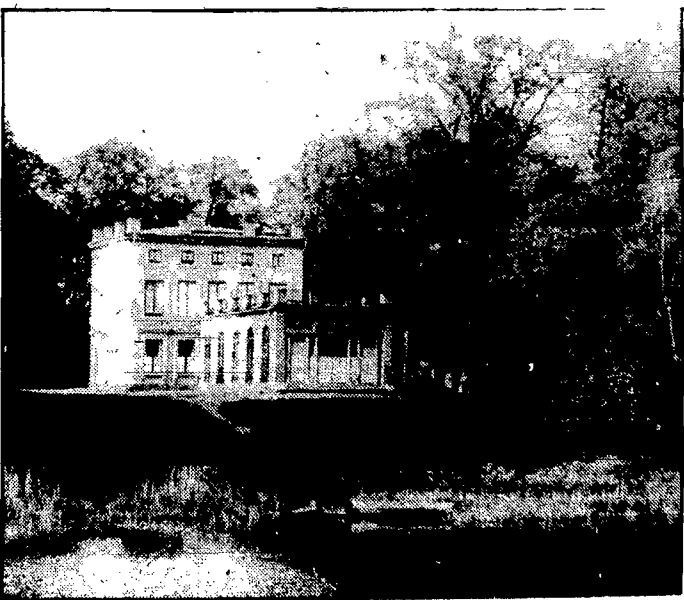
Pałac pod Sztokholmem — własność szwedzkiego następcy tronu.

duży szacunek. A największy będzie pewno szacunek, sportowców i kinomanów. Prawda? S. D. B.