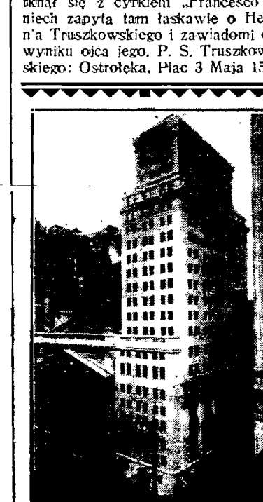
Gmach giełdy w Nowym Jorku, o którym często wspomina się w ostatnim czasie w związku z kryzysem, jaki przeżywa Ameryka.