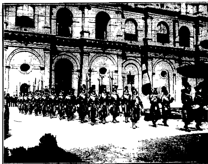
Słynna gwardia szwajcarska, pełniąca służbę wewnętrzną w Watykanie — w czasie dekadły przed swym dowódcą p.J. Hirschaub.