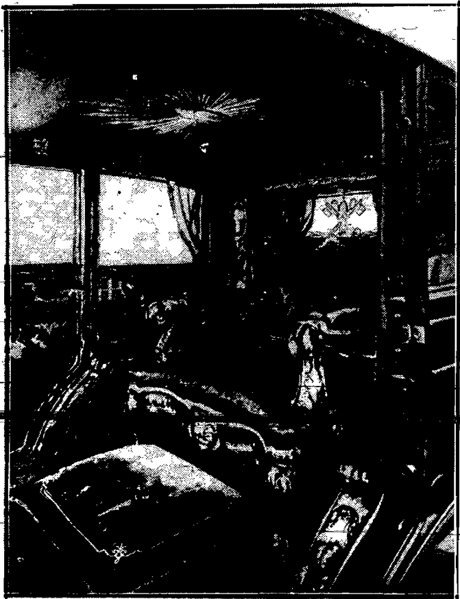
Złoty tron we wnętrzu samochodu Ojca Świętego, ofiarowanego mu przez miasto Medjolan, a przedstawiającego wartość 3 milionów lirów, czyli milion złotych.