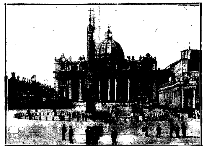
Kościół Świętego Piotra w Rzymie, Serce Watykanu i serce katolickiego świata.

ciekawych turystów ze wszystkich części świata.