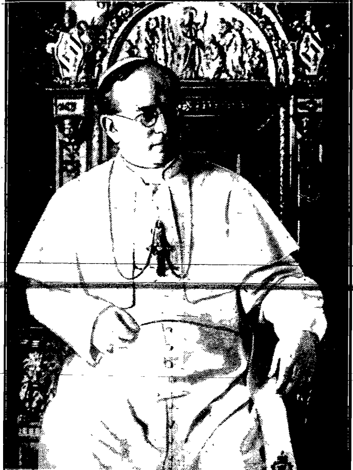
Ojciec Święty, Papież Pius XI (dawniej Achilles Ratti, nuncjusz apostolski w Polsce).

Tu, w przepysznych grobowcach śnią snem wiecznym Papieży — twórcy i gromadziciele tych wszystkich cudów, tu zebrani są najcudowniejsze twory ludzkiego geniuszu, tu ciągną miliony pobożnych pielgrzymów i