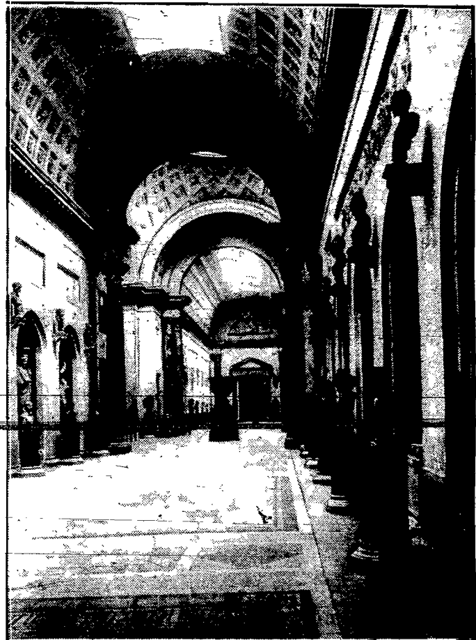
Jeden z korytarzy watykańskiego muzeum Piusa i Klemensa, zawierający arcydzieła rzeźby artystycznej.