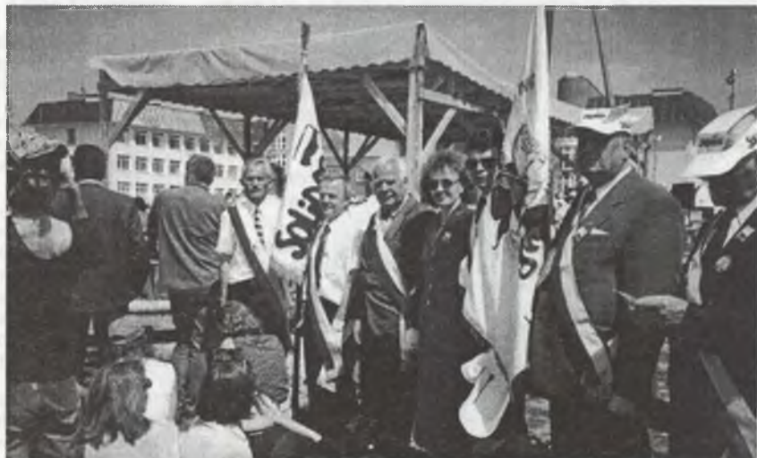
Początki sztafety ZR podczas mszy papieskiej w Drohiczynie.