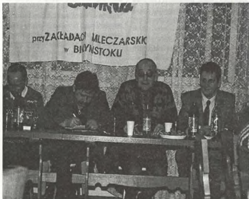
Prezydium KZ NSZZ „Solidarność” Mitex Białystok.