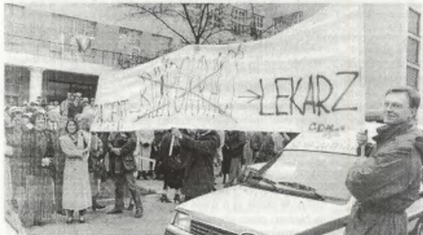
Na powyższych zdjęciach: manifestacja białostockiej służby zdrowia w dniu 15.11.br.