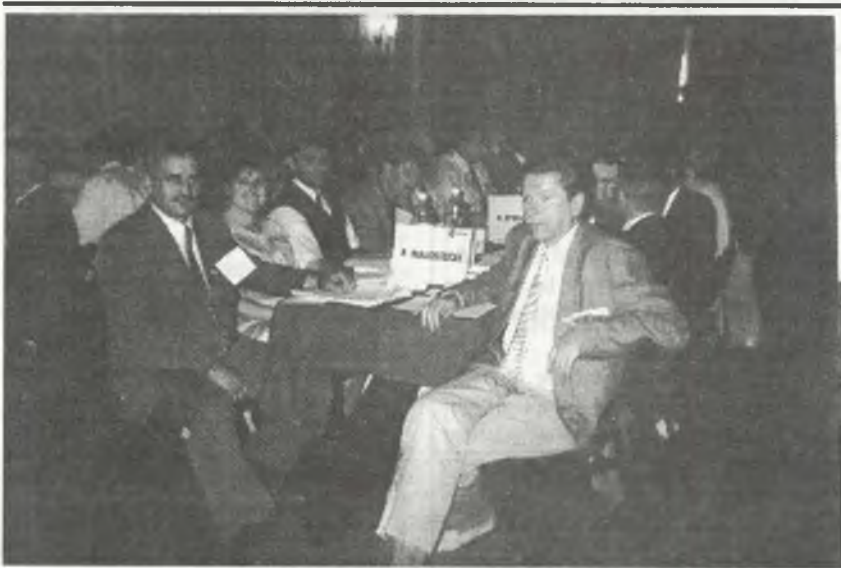
Delegaci Regionu Białystok na VIII KZD w Poznaniu.