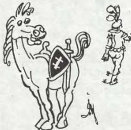
Rys. Wojciech Załęski