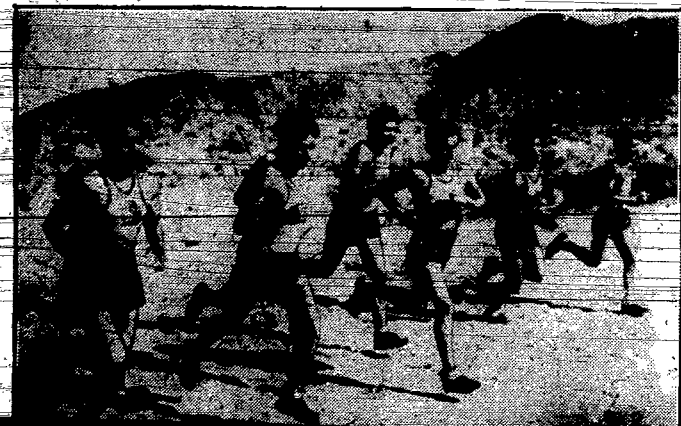
Indyjscy zawodnicy, którzy trenują się przed zbliżającą się Olimpiadą