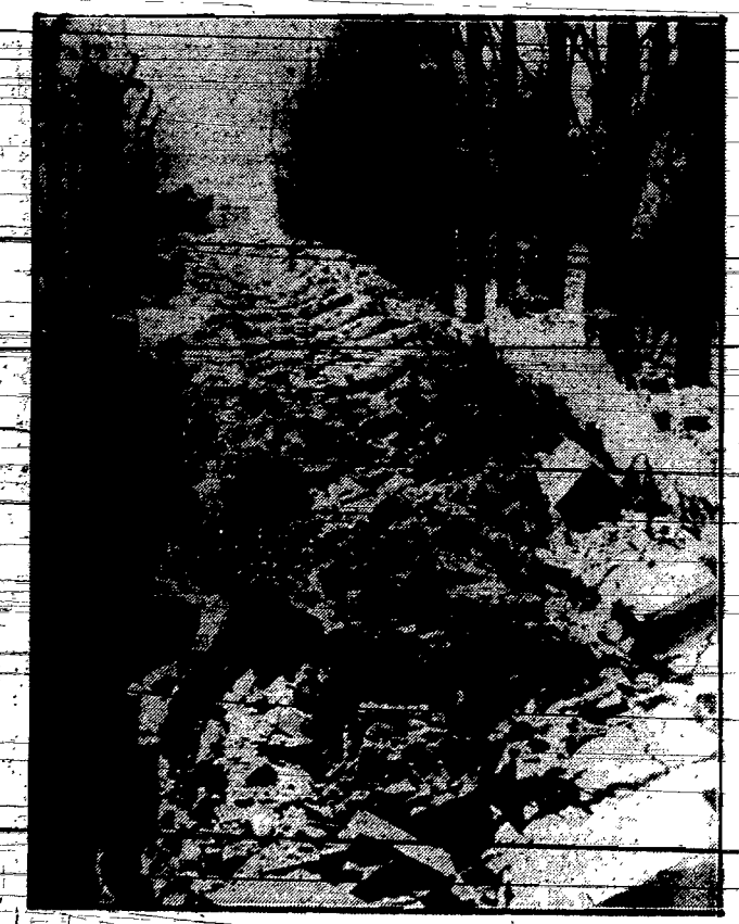
Jakgdyby zapowiedź strasznej katastrofy amerykańskiej, nawiedzono miasteczko Rumunji, Buka-es-zet, „lekkie” trzesienie ziemi. Oto jedna z ulic, dotkniętych tą klęską.