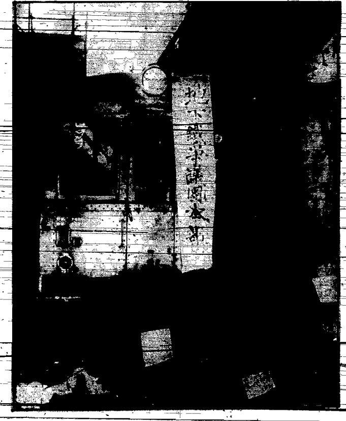
Urzednicy i pracownicy tramwajów miejskich w Tokio ogłosili strajk na tle zarobkowym. Wagony otoczono drutami, przez które biegnie prąd, tak, że policja jest zupełnie bezsilna.