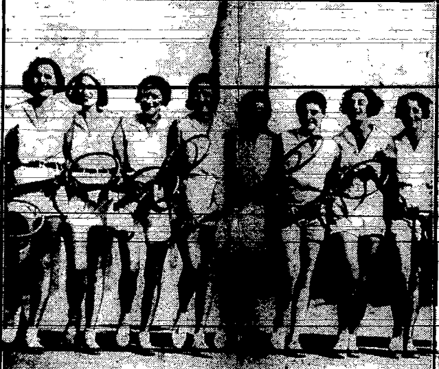
Zwolenniczki pięknej gry w tenisa lastnia ostatnio wyodone kostjumy, złożone tylko z koszulek bez rękawów i krótkich spodenek.