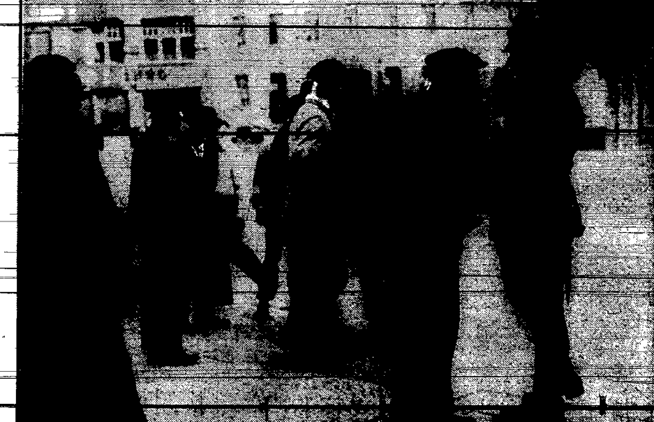
W okresie wyborów w Niemczech, władze bezpieczeństwa tamtejsze mają dużo roboty. Na zdjęciu — podziemia scena — rewizje osobiste na ulicach Berlina.