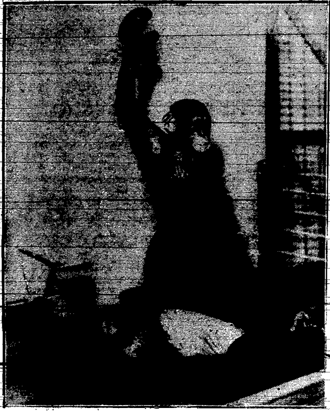
Parka szymbanso w ogrodzie zoologicznym. Sl. Louis (V. S. A.) z zamknięciem ubrawia boksy. Zmokautowany Koko leży na deskach, zwycięzca — Kiki — triumfuje.

Mając lat 16 poznałam pewnego Pana, którego pokochałam pierwszą miłością. Będąc niedoświadczoną w praktyce życiowej, uwierzy-