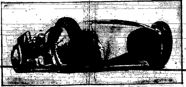
„Błękitny ptak” — kolosalnej mocy samochód słynnego kierowcy Campbella, który chce w Daytona Beach przewyższyć szybkość 400 km. na godz.