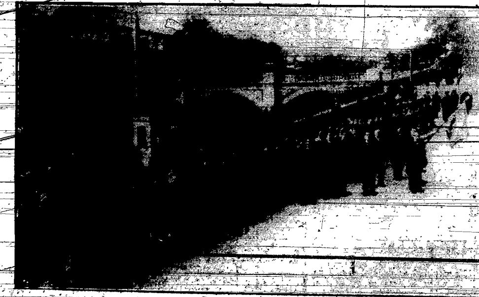
Oddział studentów i skautów chińskich zorganizowane na wzór europejskiej milicji w Szanghaju.