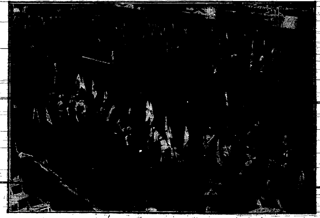
Mundury historyczne jazdy niemieckiej na otwarciu tygodnia jeździeckiego w Bertinie.