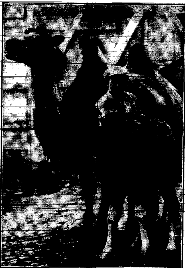
Wielbłądzica dwugarbna z strasburskiego cyrku „Gaida” ze swoim trzydniowym „mimowłociem”.