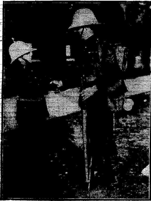
Przed koszarami marynarki wojennej w Dartmouth — pożegnanie przyjaciół — małego kadeta i podoficera piechoty morskiej należącego do oddziałów wyjeżdżających do Chin.