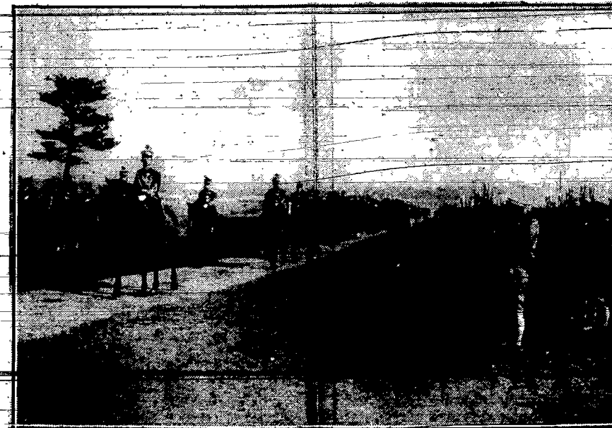
Cesarz japoński Hirohito ze switą przed frontem jednego z pułków piechoty w czasie generalnego przeglądu oddziałów wyruszających do Chin południowych.