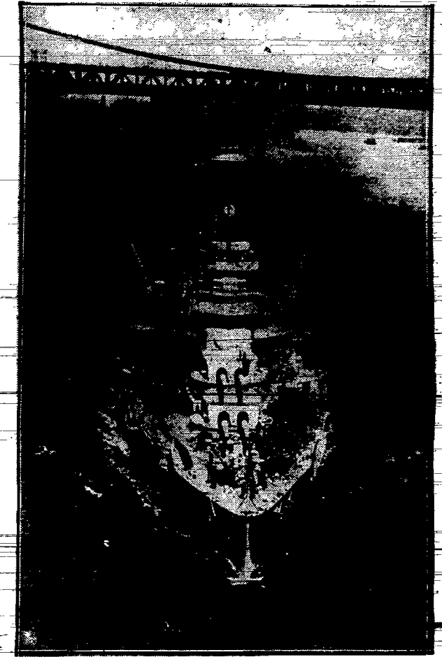
Jeden z 65 amerykańskich kolosów morskich, wysłanych do Chin „Wyoming” opuszcza port Nowojorski. Olbrzymia flota Pacyfiku płynie w kierunku Szanghaju, wioząc 7.000 żołnierzy, nie licząc załogi.