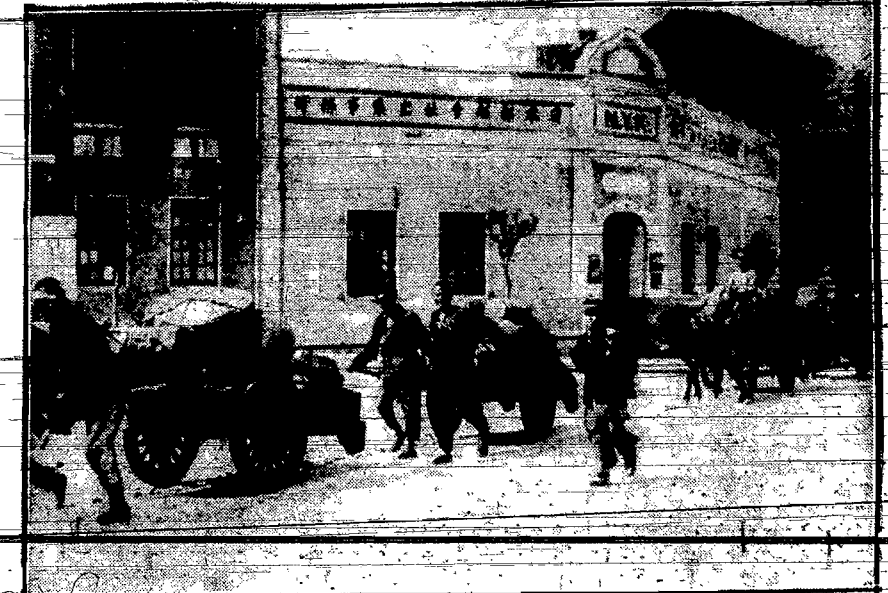
Ludność stolicy Chin opuszcza pustymi ulicami miasto unosząc ze sobą dobytek. Jak do miast deperze ostatnie — japońskie okręty wojenne rozpoczęły bombardowanie Nankinu. Wśród ludności wybuchła panika.