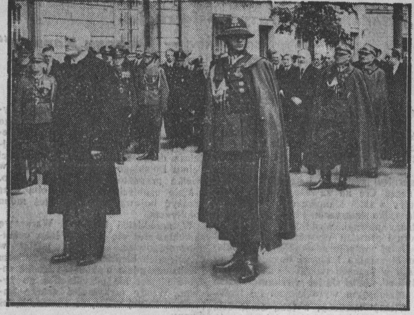
P. Prezydent Rzplitej kroczy w kondukcje żałobnym. Nieco z tyłu idą Marszałek Smigły-Rydz, marszałek Senatu Al. Prystor, premier gen. Sławoj Składkowski i wicemarszałek Sejmu Schaezel.

Najwyżsi Dostojnicy Państwa, Rząd in corpore, Senat i Sejm, wojsko, przedstawiciele licznych organizacji oraz wielkie rzesze publiczności wzięły wczoraj udział w oddaniu ostatniej posługi zasłużonemu mężowi stanu, marszałkowi Sejmu, ś. p. Stanisławowi Carowi.