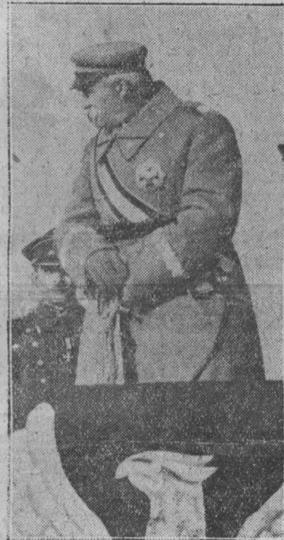
Dnia 11 listopada 1934 roku Marszałek przyjmował defiladę na polu Mokotowskim z trybuny, stojącej w tym samym miejscu, gdzie wczoraj stała Trumna, przed którą odbyła się ostatnia, niezapomniana defilada Jego Armii.