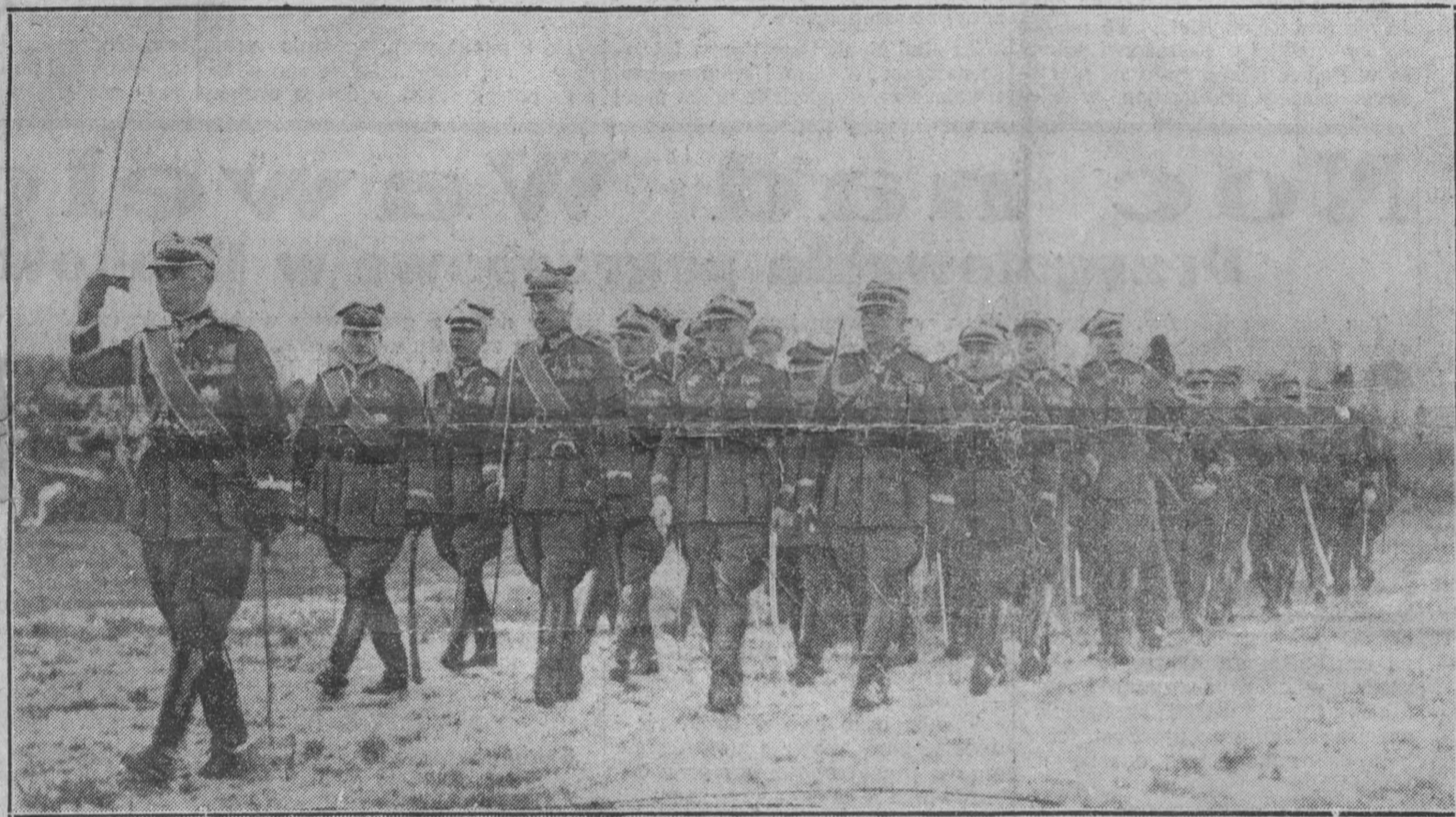
Ostatnia defilada przed Wodzem rozpoczęta — najbliżsi współpracownicy Marszałka, inspektorowie armii, dowódcy korpusu i najwybitniejsi generałowie defilują prowadzeni przez Generalnego Inspektora Sił Zbrojnych gen. Rydza Śmigłego. W pierwszym rzędzie generałowie (od lewej): Żeligowski, Sosnkowski, Osiński i Berbecki.