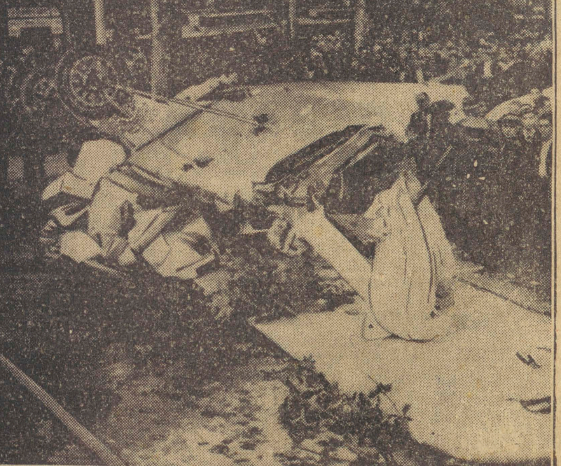
Na jedną z najbardziej ożywionych ulic Barcelony spadł wojskowy samolot i rozbił się doszczętnie. Załoga jego mimoto uszła śmierci.

Miasto, liczące około 12.000 ludźmi, objęte jest paniką.