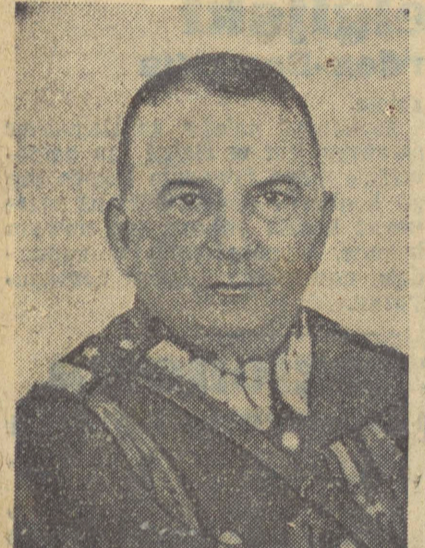
Dowódca O. K. Toruń gen. Paślawski, kandydat na stanowisko wojewody białostockiego

Umowy te stawiają sobie za cel zupełnie wyraźnie utrzymanie pokoju na wschodzie Europy.