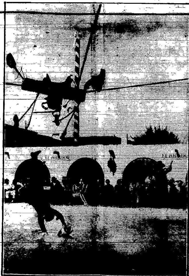
W Palm Springs w Kalifornii wynaleziono nowy „sport” — a raczej zabawę dla znużonych milionerów, polegającą na tem, iż amator-jeździec dosiada „konia” zbudowanego z kawałków drzewa, a zawieszono go na linie nad basenem pływackim, przyozdobionym utrzymaniem się na tym „wierchołcu” przez dłuższy czas, gdy kilku ludzi targa linę, chcąc strącić „jeźdźcę” z siodła i zwałić go w wodę.

pana, z prośbą o zamieszczenie notatki, że nie jest autorem tych wierszy i z autorem nie jest nawet spokrewniony.