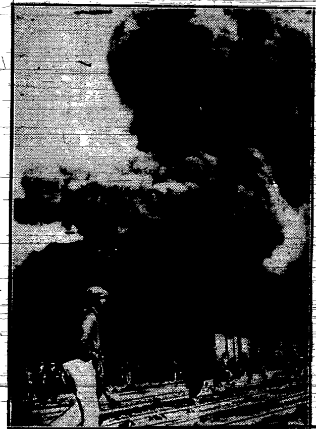
W miejscowości Charlotte w Stanach Zjednoczonych spłonęły trzy olbrzymie tanki gazoliny, każdy o pojemności 90.000 litrów.