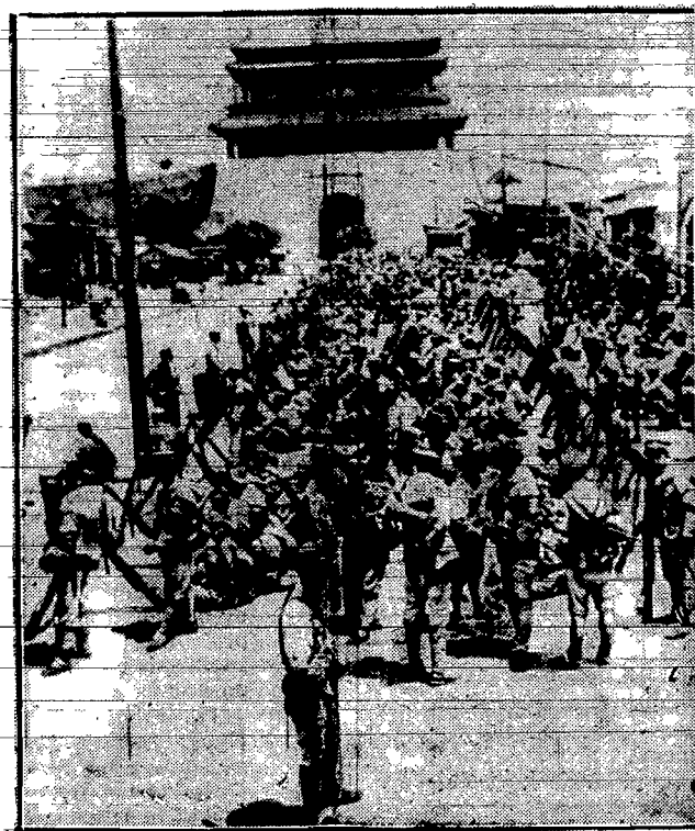
Doddziały piechoty chińskiej na chwile przed wymarszem na front mandzurski.

które się tobie nie podobają i te, które ja nie mogę kupić. — Jeżeli mój szef nie odmówi tego, co powiedział, od pierwszego przestaje pracować. — A cóż on takiego powiedział? — Wymówił mi posadę.