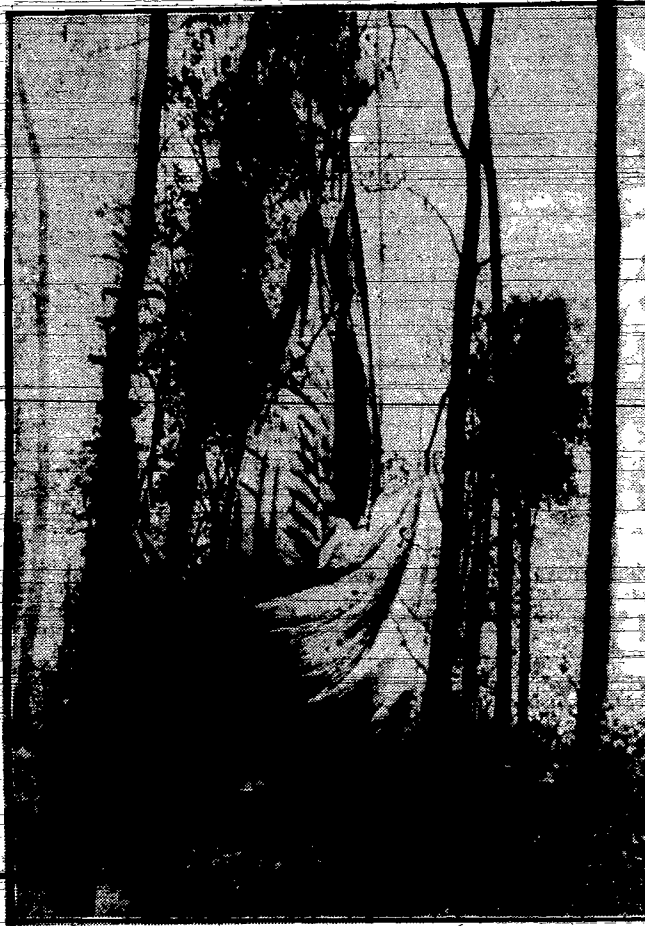
Amerikanin, kpt. Gray Hawthorne wzbił się balonem na rekordową wysokość 13 tys. metr., skąd wskutek wybuchu gazu spadł na ziemię, ponosząc śmierć na miejscu. Na zdjęciu — powłoka zniszczonego balonu zaplątana w gałęziach drzew.