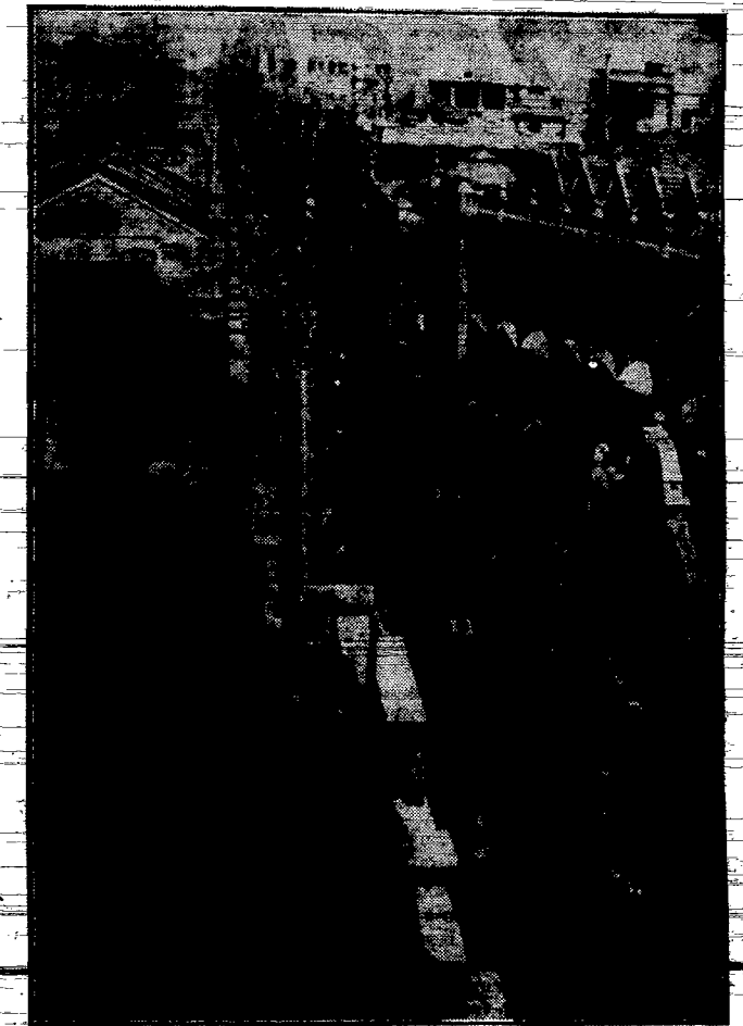
Zdjęcie z chińskiego miasta Hankou, nawiedzonego klęską powodzi. Komunikacja odbywa się tam przy pomocy łodzi i czółen, a nawet bańki.