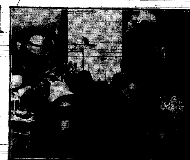
„wewnątrz pracowni kapeluszniczej...“