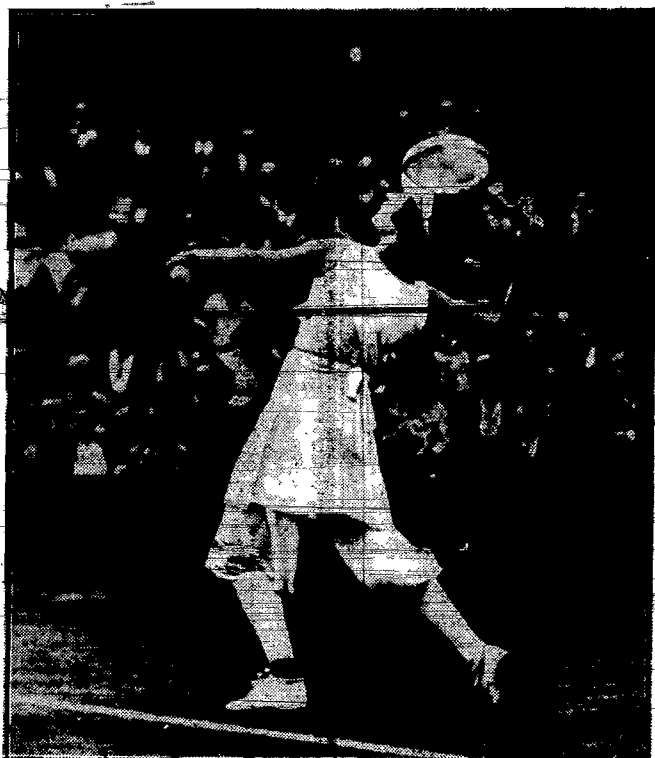
Hiszpańska mistrzyni tenisowa d'Alvarez propaguje na turnieju w Wimbledonie tę nową, ekscentryczną modę.

— Kupłam proszek, aby mego meza odzwyczaić od palenia. Już trzy razy wyspałam mu ten proszek do kawy.