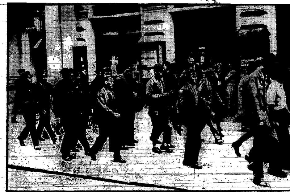
W szeregu miast niemieckich, między innymi w Hamburgu, odbyły się rozruchy bezrobotnych pod hasłem: „Żadamy chleba i pracy!“ Na zdjęciu widzimy policjantów, odprawiających grupę aresztowanych po rozproszeniu demonstracji.