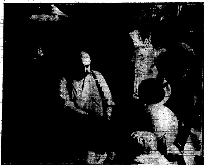
„mocno na „turmaszynie“ osadzony kapelusz...

Codzienna wędrówka po fabrykach, warsztatach i biurach