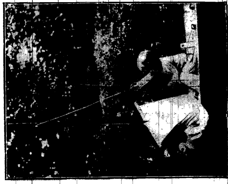
Mały bąk wprawia się w zeglatstwo.

jest źle. Poprawi się... — O zarobki pan pyta? Nie- szczególnie. W lecie są zawsze ogórki. A wogóle teraz nie to, co było dawniej.