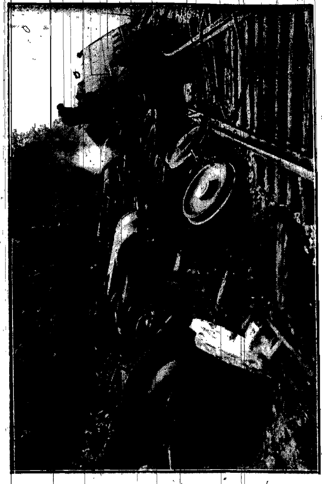
Przedstawia teręń strasznej katastrofy ekspresu Pittsburgh — Buffalo, jaka zdarzyła się skut- kiem podmycia toru.