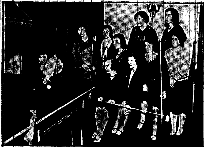
Kobiety w Anglii zaczynają się pasjonować do czysto męskiej dotąd gry — bilarda.