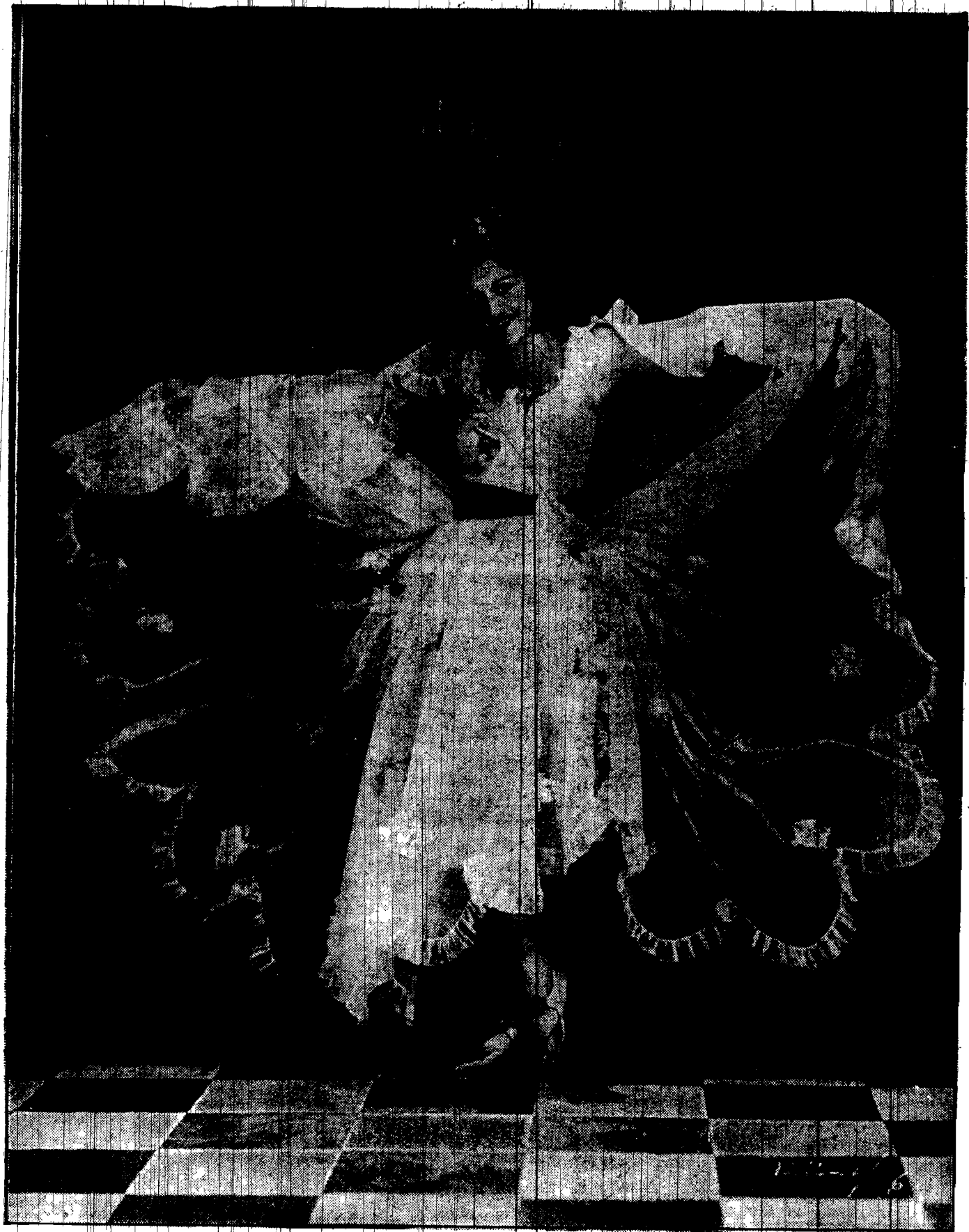
Czy ta śliczna, a mało znana artystka, nie przypomina pięknego motyla?