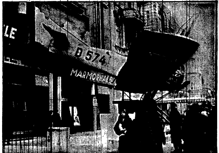
ale reklama filmu, ilustrującego wyprawę Byrda do bieguna — ustawiona przed jednym z kin w Berlinie.