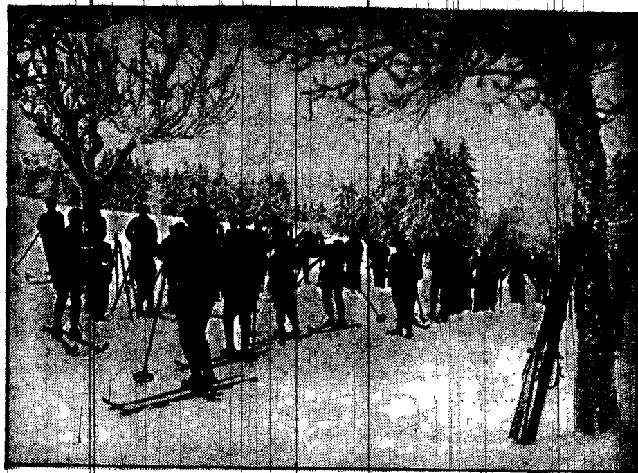
Start do narciarskiego biegu patroli wojskowych w Górnym Harcu w Niemczech.