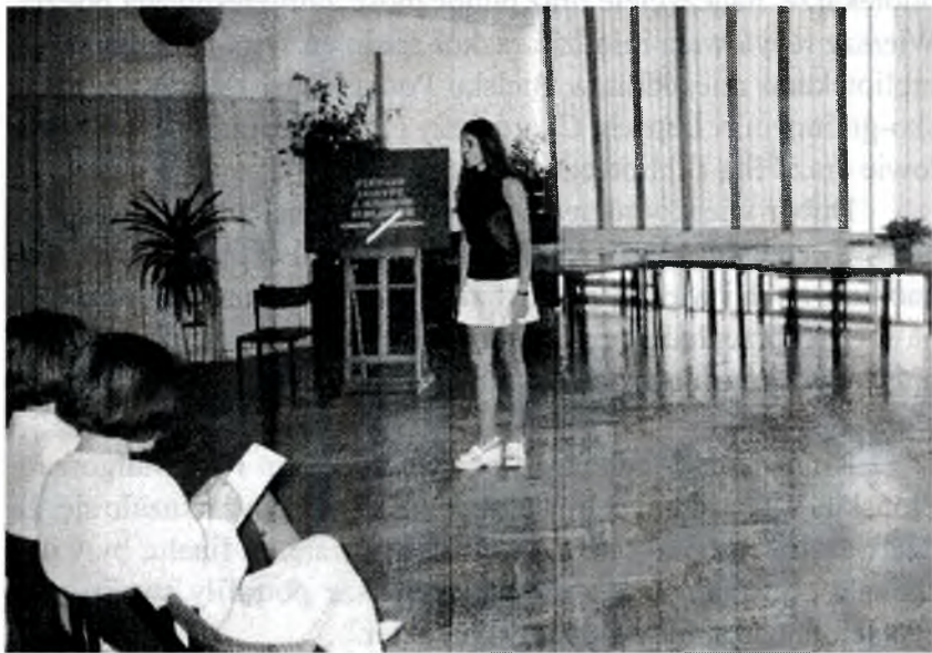
Eliminacje wojewódzkie konkursu „Wiersze dobyte z mroków bibliotek”