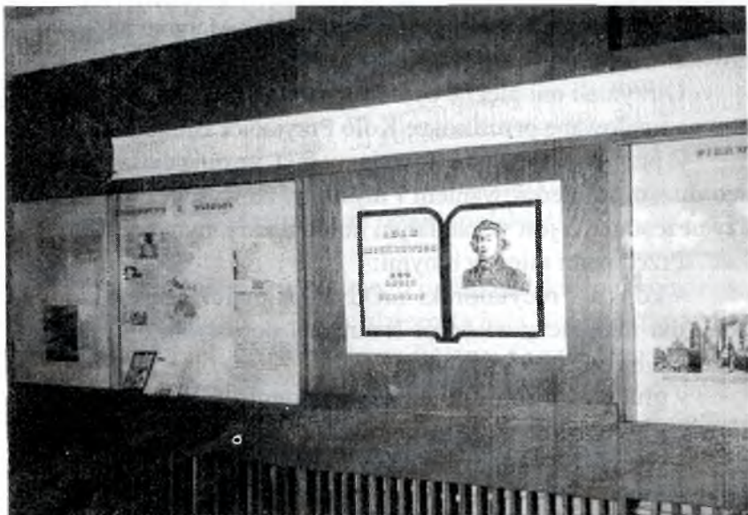
Fragment wystawy: "Ktokolwiek będziesz w nowogródzkiej stronie..." w MBP w Hajnówce

Szkoły Podstawowej Nr 5 w Hajnówce, a „tworzyli” pod kierunkiem nauczycielki plastyki Pani Elżbiety Chmielewskiej.