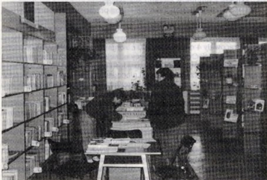
Oddział dla dzieci Biblioteki Publicznej w Łapach.

Jako jedna z nielicznych bibliotek samorządowych zadbała o poprawę usług czytelniczych wprowadzając i stopniowo rozwijając komputeryzację procesów bibliotecznych.