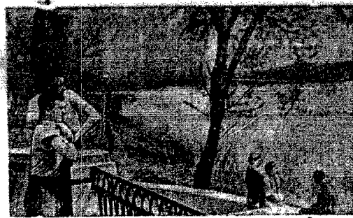
На берегу озера (Славянский курорт, Сталинская обл.)