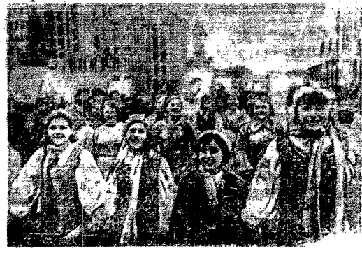
Весело и радостно праздновали Первомай трудящиеся столицы орденоносной БССР - Минска.