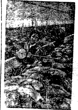
Kolchoz imienia M. I. Kalinina (rejon myśkowskiego, obwód moskiewski) otrzymał pierwszy razny rozpylacz doświadczenia, wyprodukowany przez Instytut naukowo-badawczy gospodarstwa warzywnego. Ten rozpylacz daje równomierne rozpraszanie i nadaje się do zastosowania w warunkach, gdzie nie ma możliwości zaprawić każdy list rośliny ze spodu.