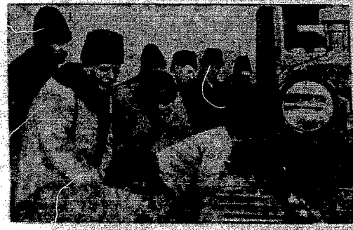
Колхозники колхоза «Новая жизнь» (село Кычкины, Бендерский уезд) осматривают первый трактор, прибывший для обслуживания весенне-полевых работ.

Колхоз имени 17 сентября Гривского района С.Х.