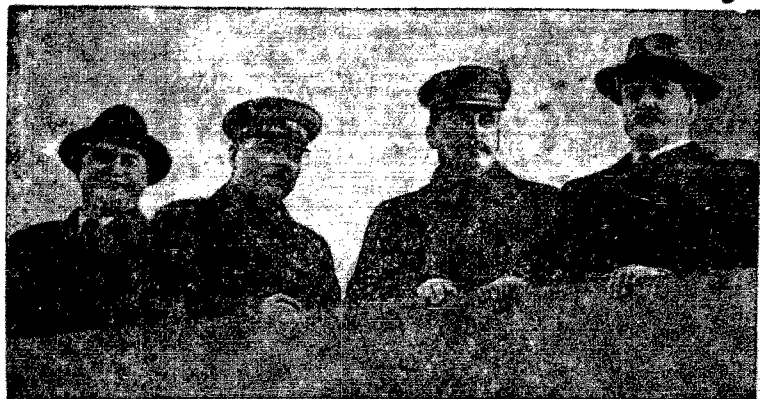
Z prawej ku lewej: towarzysze W. M. Mołotow, J. W. Stalin, K. E. Woroszyłow i G. M. Dymitrow na trybunie mauzoleum.