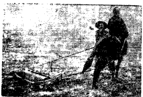
Chłop mandżurski przy wiosennych robotach polny h.