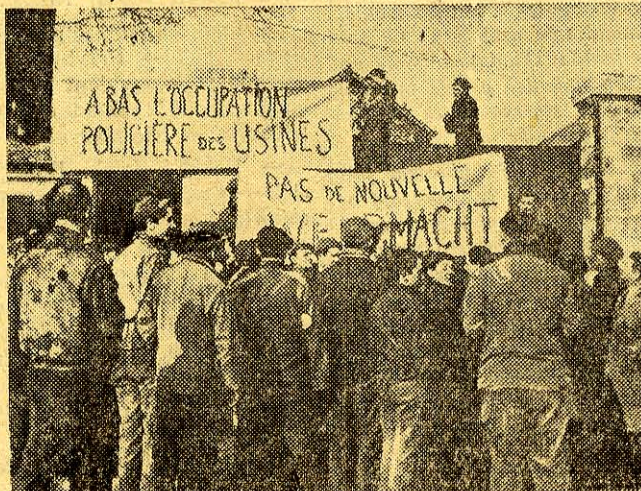
Robotnicy francuscy protestują przeciwko imperialistycznej polityce rządu.

Pozdrawiamy narody krajów kolonialnych i zależnych walczące z imperializmem o wolność i niepodległość!