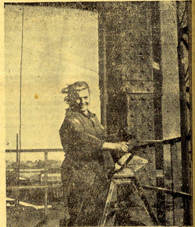
Zakłady Metalurgiczne im. Klementa Gottwalda w Czechosłowacji.

Pozdrawiamy lud pracujący Francji i Włoch mężnie walczący pod sztandarem swobód demokratycznych, niepodległości i pokoju, przeciw agresywnym paktom i zbrojeniom!