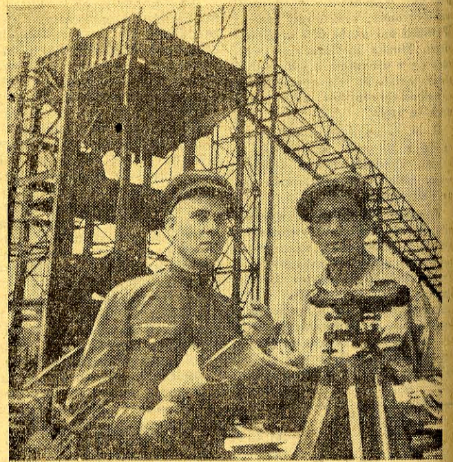
Na budowie Kujbyszewskiej Elektrowni Wodnej.

Czerwona gwiazda na kremłowskiej wieży jest symbolem pokojowego budownictwa ZSRR. Pod jej znakiem człowiek radziecki tworzy wielkie dzieła komunizmu.