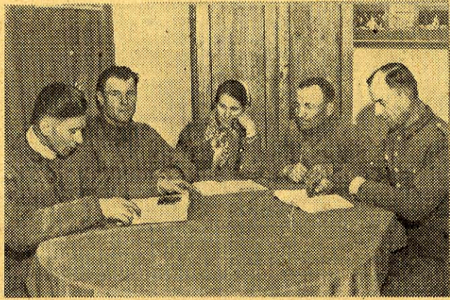
Pragnąc dokładnie zaznajomić się z życiem i działalnością Józefa Stalina powstają w PGR-ach, spółdzielniach produkcyjnych i gromadach liczne kółka studiujące życiorys Towarzysza Stalina. Dogłębne poznanie Jego nauk pozwoli pracującym chłopom wzmocnić jeszcze bardziej walkę o socjalistyczną wieś i o szybki postęp w rolnictwie.