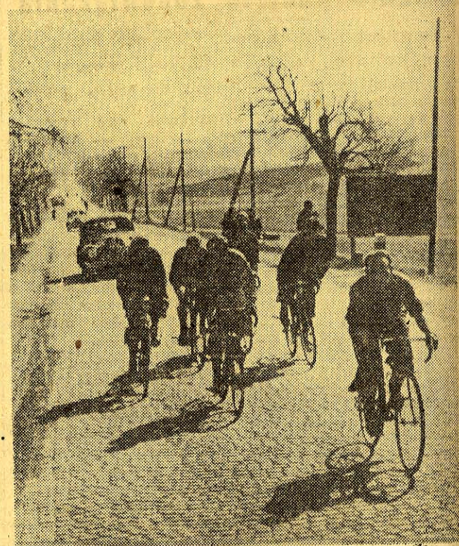
Na obozie przygotowawczym w Hartha pod Dreznem trenują najlepsi kolarze NRD do tegorocznego Międzynarodowego Wyścigu Pokoju Praga — Berlin — Warszawa. Na zdjęciu: Grupa trenujących kolarzy.

Kolarze NRD przygotowują się do VI Wyścigu Pokoju