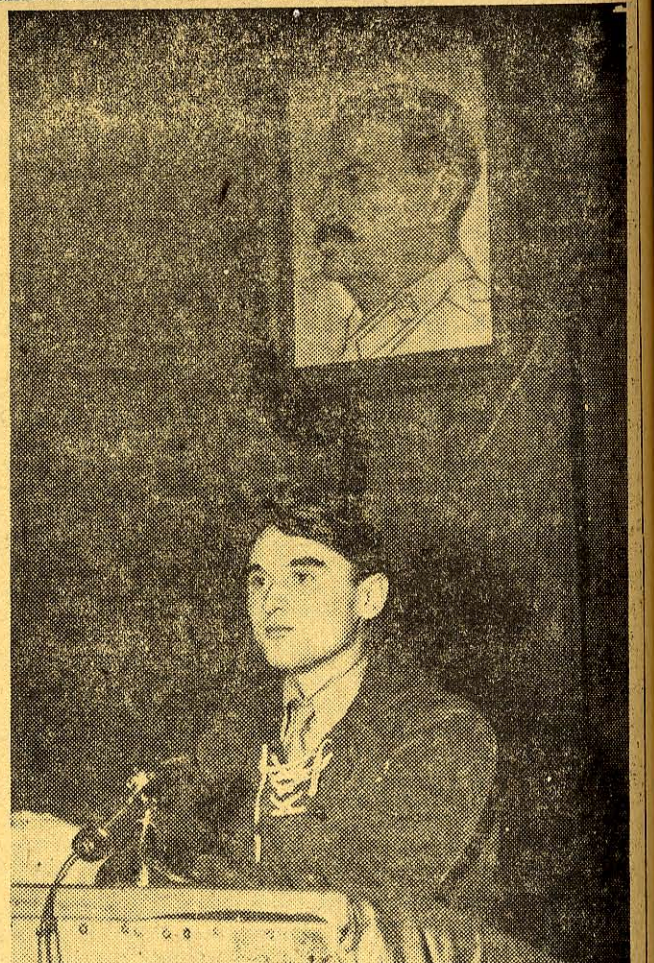
Na otwartym zebraniu podstawowej organizacji partyjnej PZPR przy Akademii Sztuk Plastycznych w Warszawie...