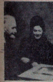
General Charles de Gaulle przybył wczoraj rankiem 18 bm. wraz z małżonką do lotniska w Colombey-les-Deux-Châteaux. Był gościem w drugiej turze wyborów prezydenckich.

WASZYNGTON (PAP) — Zachodniemiecki kanclerz L. Erhard przybył w niedzielę wieczorem do Waszyngtonu z dwudniową oficjalną wizytą. Na kolonieju w bazie wojskowej odwiedzali go wiceprezydent H. Humphrey i sekretarz stanu D. Rusk.