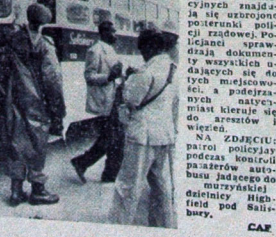
W obawie przed następnymi falami demonstracji w miejscowościach...