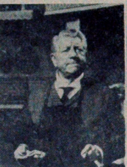
Jean Gabin w filmie „Monstrieur”

Wzmoczenie czujności i ochrony jest konieczne w stosunku do mienia społecznego i prywatnego. Zamach na mienie prywatne była dla przestępcy szkołą przed zde-