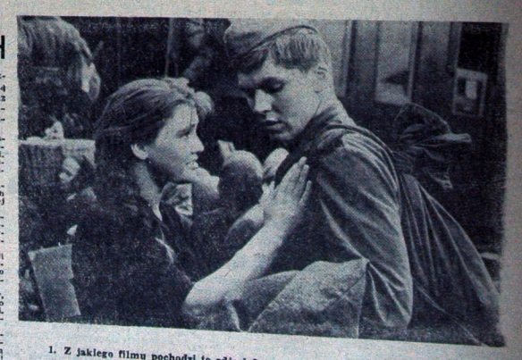
1. Z jakiego filmu pochodzi to zdjęcie?

W naszym Konkursie Filmowym, zamieszczamy sześć zdjęć Dwa z nich pochodzą z filmów nowych, wyświetlanych po raz pierwszy w tegorocznych Dniach Filmu Radzieckiego, zaś w czterech pozostałych rozpoznamy filmy z lat ubiegłych. Pod każdym ze zdjęć, zamieszczone jest pytanie. Pierwsze pytanie brzmi: "Zadania, połączona pod zębami, nie odpowiada, wystraszony wiec...". Drugie pytanie brzmi: "Trzeci dzień, który...".