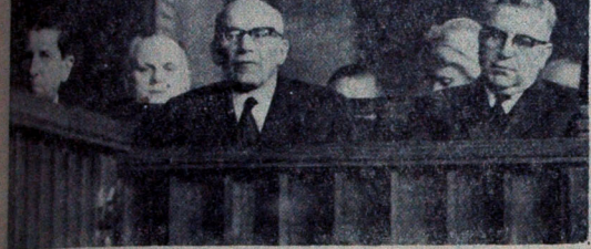
Wieloletni Sejm - Cieszył wyjątkową w dniu 12.XI.65, trzeciej w bieżącej kadencji, sesji plenarnej w Warszawie. W tym dniu, plenarza posiedzenia Sejm. Na posiedzeniu przybyli: Władysław Gomułka, Edward Ochab, Józef Cyrankiewicz, członkowie Rady Państwa i rządu. W składzie dla publicystyki: Władysław Gomułka i Edward Ochab. W składzie dla publicystyki: Władysław Gomułka i Edward Ochab.