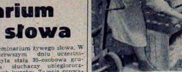
Zanim jabłka znajdą się w sklepach muszą być posortowane. NA ZDJĘCIU: sortowanie jabłek przez pracowniczkę „Witaminy”.

Kursy języka rosyjskiego organizowane również w Towarzystwie Wiedzy Powszechnej. Zajęcia rozpoczął się w piątek, 29 bm, o godz. 17, w szkole nr 3 przy Al. I Ma. Zajęcia na wszystkich kursach języków obcych, prowadzonych przez ZSW, odbywają się również w salach tej szkoły. Cieszą to nas bardzo, gdyż od dawna już postawiliśmy sobie za cel poprawienie warunków lokalowych tych kursów.