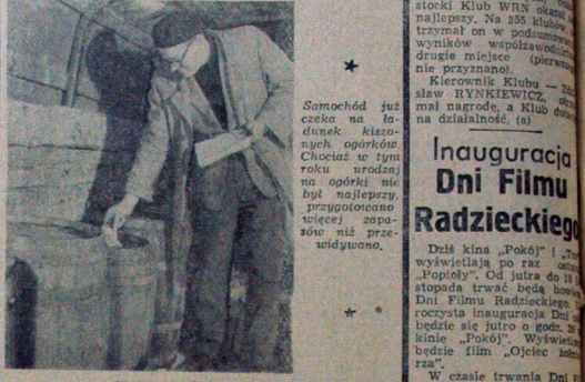
Cebula, w której zapotrzebowanie na nasze sklepy, pochodzi z okolicznych powiatów. NA ZDJĘCIU: przygotowanie cebuli do sklepowej półki.

Już od samego rana wędrują do naszych sklepów transporty warzyw i owoców z magazynów „Witaminy”. W pomieszczeniach magazynowych piętra się skrzyżowały zapelnione cebulą, jabłkami, różnymi warzywami, które jeszcze dziś narzązają się na naszych stołach.