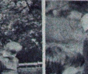
Wielki sukces zapomniał w brytyjskim Porcie lotniczym Gatwick znajduje się bardzo pokatane liście wietniczych. Wystawiono je na honorarium...