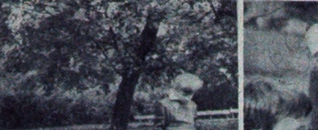
Wielki sukces zapomniał w brytyjskim Porcie lotniczym Gatwick znajduje się bardzo pokatane liście wietniczych. Wystawiono je na honorarium...