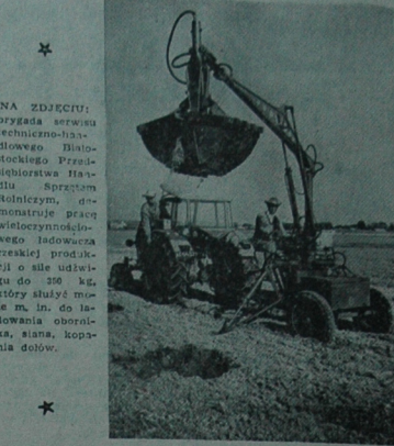
NA ZDJĘCIU: brygada serwisu technicznego-hawdowski Biurostoskiego Przedsiębiorstwa Handlowo-Przemysłowego Rolniczym, demonstruje pracę wielozadaniowego jadowniczki czeskiej produkcji o silniku o mocy 350 KM, który służył moźe m. in. do ładowania obrabiarki, silnika, koparki, aolana.