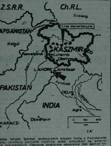
Mapka terenu działań wojennych między Indią a Pakistanem. Strzałki określają kierunek natarcia armii indyjskiej na pozycje wojsk pakistańskich. Czarna linia oznacza granicę, oznaczoną jest sporne terytorium Kaszmiru.

BONN (PAP) - W noc 5 stycznia zmarł w Bonn 86-letni prof. Staudinger laureat Nagrody Nobla w dziedzinie chemii. Wierzył, że w dziedzinie chemii tworząc sztuczny.