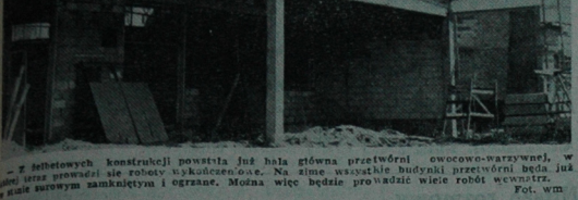
— W szkieletowych konstrukcjach powstają już hala główna przetwórnii owocowo-warzywnej, w której teraz prowadzi się roboty wykończeniowe. Na ziemi widać wszystkie budynki przetwórnii będą już w całości budowane zamkniętą i ogrzaną. Można więc będzie prowadzić wiele robót wewnątrz.