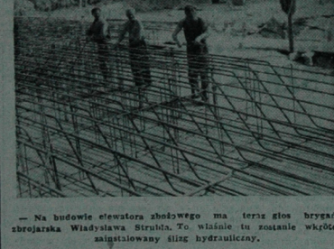
— Na budowie elevatora szklowego ma teraz głos brygada szkieletowa szkieletowa szkieletowa.

i dlatego na budowach Przemysłówek dominują maszyny obsługiwane przez niewielu ludzi. Odwiedliśmy kilka placów budowy. Na wznoszonym w Starosielsku kompleksie budynków dla Zakładu Wytwarzania Maszyn i Urządzeń Przemysłu Społycznego trwa o-