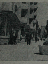
Coraz ładniej wygląda nasze miasto — oto fragment nowej zabudowy ulicy Marchlewskiego.

Na kursach tych będą miała zdobyć zawody — kursach — produkcyjnych, bielizny, karmy. Nauka na kursach będzie bezpłatna. (31)