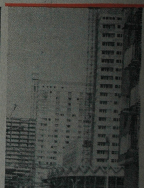
Strona Wschodnia Placu Defilad prezentuje się już okazale. Tryb 21 piętrowe widoczne mieszka. W poprzedniej fotografii widoczny był budynek, w którym mieszkał prezydent Komisji Edukacji, Kultury i Świeższosci Ministerstwa Edukacji, Kultury i Nauki. W tej chwili budynek ten jest w posiadaniu Instytutu Historii Państwa. W tle widoczny jest budynek Ministerstwa Edukacji, Kultury i Nauki. W pierwszym planie widoczny jest budynek Ministerstwa Edukacji, Kultury i Nauki. W tle widoczny jest budynek Ministerstwa Edukacji, Kultury i Nauki. W pierwszym planie widoczny jest budynek Ministerstwa Edukacji, Kultury i Nauki.