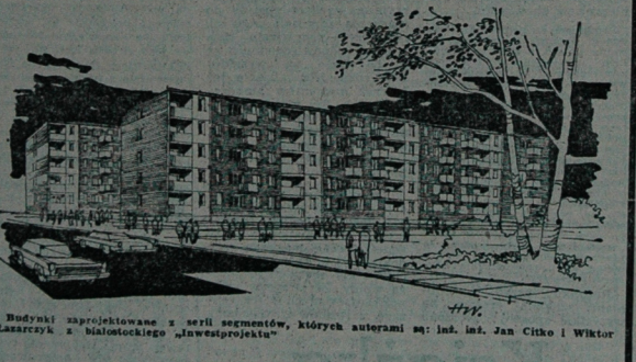
Budynki zaprojektowane z serii segmentów, których autorami są: inż. inż. Jan Ciko i Wiktor Łaszczak z białostockiego „Inwestprojektu”