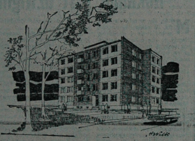
Projekt typowego punkta, opracowany w „Inwestprojekcie”

Czy szybko pan ustawił szuby? — potulnie spytałem, aby nie obrazić „maistrza”. — Szuby ustawił, ale jeszcze — odpowiedział. Na razie — na urlopie. — Czy nie protestowałem. Skłony też radzi, należy się im wypoczątek. Przeczekaj. Może wreszcie nadzieje się do zefirek, który wkrawa do się do mieszkania, obwołanie kłosek i wód rodzinę ochładza? Wierzę w złotą, polską jesień. CWIR