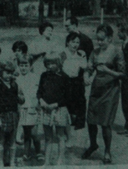
Przed domem PTT-K w Augustowie.

Swidrowanie wyczerpienia zostały w terminie usunięte. Ogólna wartość zrealizowanych poleceń, nie licząc prac wykonanych w czasie spotkań, wynosi 315 tys. zł. (gen)