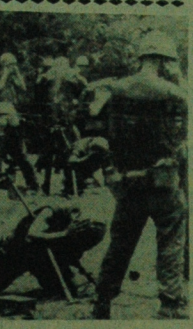
W pobliżu bazy Da Nang w Wietnamie Południowym rozpoczęła się wojna operacyjna przeciw partyzantom z ZJEDNOIIONEJ ARMII WIEJOWEJ Wietnamu walc w dżungli.

ALGIER, PARYŻ, KAIR, LONDYN (PAP) — Na skutek surowej cenzury, przerw w połączeniach telefonicznych i dalekopisowych informacja, które nadeszły we wtorek na temat sytuacji w Algierze i w całym kraju są bardzo skąpe. Jednym z głównych punktów zainteresowania są problemy związane ze zbliżającą się konferencją afrykańsko-azjatycką. Wydarzenia algierskie budzą w dalszym ciągu olbrzymie zainteresowanie na całym świecie.