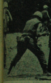
W pobliżu bazy Da Nang w Wietnamie Południowym rozpoczęła się wojna operacyjna przeciw partyzantom z ZJEDNOIIONEJ ARMII WIEJOWEJ Wietnamu walc w dżungli.