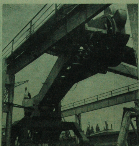
Fabryka Maszyn i Urządzeń w Kłuczkowku to obecnie wielki producent różnego typu urządzeń dla fabryk dębni, młynów, cukrowni, kotłowni energetycznych. Zakłady ma nie są z swojej produkcji również daleko poza granicami kraju eksportuje wyroby i kompletne urządzenia do Związku Radzieckiego, Rumunii, Grecji, Bułgarii, Maroka, Indii, Indonezji.

W niewielkim miasteczku angielskim Horsebridge 14 młodych ludzi stanęło do niecodziennych zawodów. Mieli oni przed sobą trudny zadanie: wypieść rozbite przy pomocy ciepłych potoków 7 starych planin. Na zwycięzców czekała nagroda w postaci galonu piwa. Rekordowy zespół uzyskał czas 6 min. i 40 sekund. (PAP)