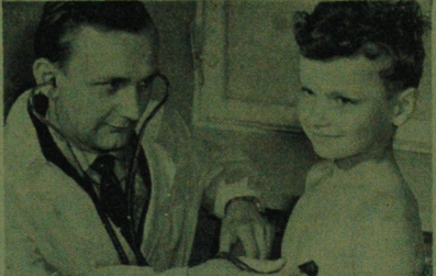
Kończy się rok szkolny. Jak każdego lata setki tysięcy młodzieży szkolnej wyjechała na zastójny odpoczynek. Obozy harcerskie, wycieczki krajoznawcze, spływy kajakowe, rajdy turystyczne i inne formy wypoczynku zostaje przedstawiana przez personel obozów, który odpowiada za stan zdrowia i wystawia świadectwa o zdaniach. NA ZDJĘCIU: badania młodzieży szkolnej.

Największe w tym względzie możliwości mają Zakłady Przemysłu Welnianego w Zambrowie (Strękowa Góra) oraz włókniarze z Zakładów Welnianych im. Platę - ośrodek wczasów wodnych w Wasilkowie. (gen)