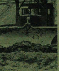
REGULACJA WISŁY W Międzyrzeciu kontynuują się prace regulacji środowiska odcinka Wisły. Okręgowy Zarząd Wodny rozpoznał w rejonie Polow Roboty - pogieblarskie związane z budową kanału dyfuzyjnego dla „Ażowów”. W kilku rejonach trwała przygotowania do likwidacji kop tarasujących koroty rzeki. NA ZDJĘCIU: do ukończenia ZAW. Przewodzenia terenu i tytuła się ciężkie sprzęty.

Rozwój szkolnictwa zawodowego sprawił, że zarówno rodzice, jak i dzieci wolały wybrać od razu taką szkołę, której ukończenie uprawnia