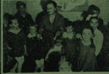
Wspólna zabawa.