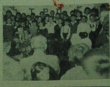
Wspólna zabawa.