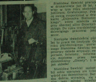
dużym stopniu wpływa na wysiłek drukarzy. Podobnie jak czytelnicy i oni mają swoich ulubionych autorów.