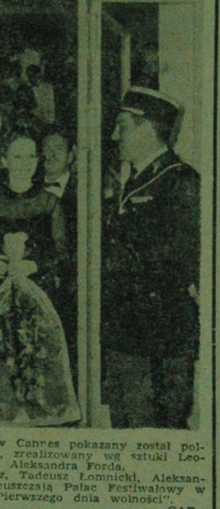
W ramach Festiwalu Filmowego w Cannes pokazany został polski film „Pierwszy dzień wolności”, zrealizowany we sztuki Leona Kruczkowskiego przez reżysera Aleksandra Forda.