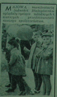
Młoda manifestacja ludności Białostocka oglądały tysiące młodych i starszych przedstawicieli naszego społeczeństwa.

Jak już informowaliśmy, Oddział Białostocki Polskiego Klubu Tancerzy, na wyjazd odbył kontakt z Klubem Tancerzy Towarzystwa Kultury Związków Zawodowych w Kownie (Litewska SRR). Na zaproszenie Danusi i Przeladki Związków Zawodowych w Kownie w najbliższym tygodniu odbędzie się kilka par tanecznych z Białostocka, aby wnieść udział w turnieju tańca towarzyskiego. Przewodniczącą jest również sędzia par tanecznych z Kowna w naszym mieście. (h)