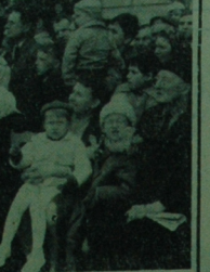
Ustawiono przez Zarząd Zieleni Miejskiej wzdłuż trasy pochodu laurki miały włożyć — można było wygodnie siedząc podziwiać marszujące kolumny manifestantów.