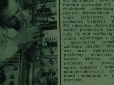
NA ZDJĘCIU: fragment urzędni nowego 26-kanałowego radiotelefonu.

Przed kilkunastu laty Gółyjskie Zakłady MORS (Morska Obsługa Radiowa Statków) były warsztatem zatrudniającym kilkadziesiąt osób. Obecnie są dużym przedsiębiorstwem, którego wyroby liczą się nawet na rynku światowym, a 19 produkowanych urządzeń ma znak jakości „A” (średnia klasa światowa). Ostatnią nową MORS, to gonimierz — eksportowane również do kilku krajów. Duże uniane wśród rybaków zdobył sobie 26-kanałowy radiotelefon, pozwalający na szybkie i łatwe porozumienie się statków między sobą oraz przebywających na wodach terytorialnych — z portem.