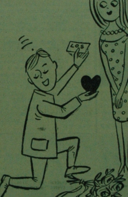
Przymyśł sobie serce i mój LOS KRAJOWEJ LOTERII PIENIĘŻNEJ KTÓRY PRZYNIESIE NAM SZCZĘŚCIE

Smaczne, wysokokaloryczne lody BAMBINO chłodzą latem, hartują zimą ŻĄDĄJ w sklepach MHD i PSS w Białymstoku. k 1063-1 BZGrał. C-2